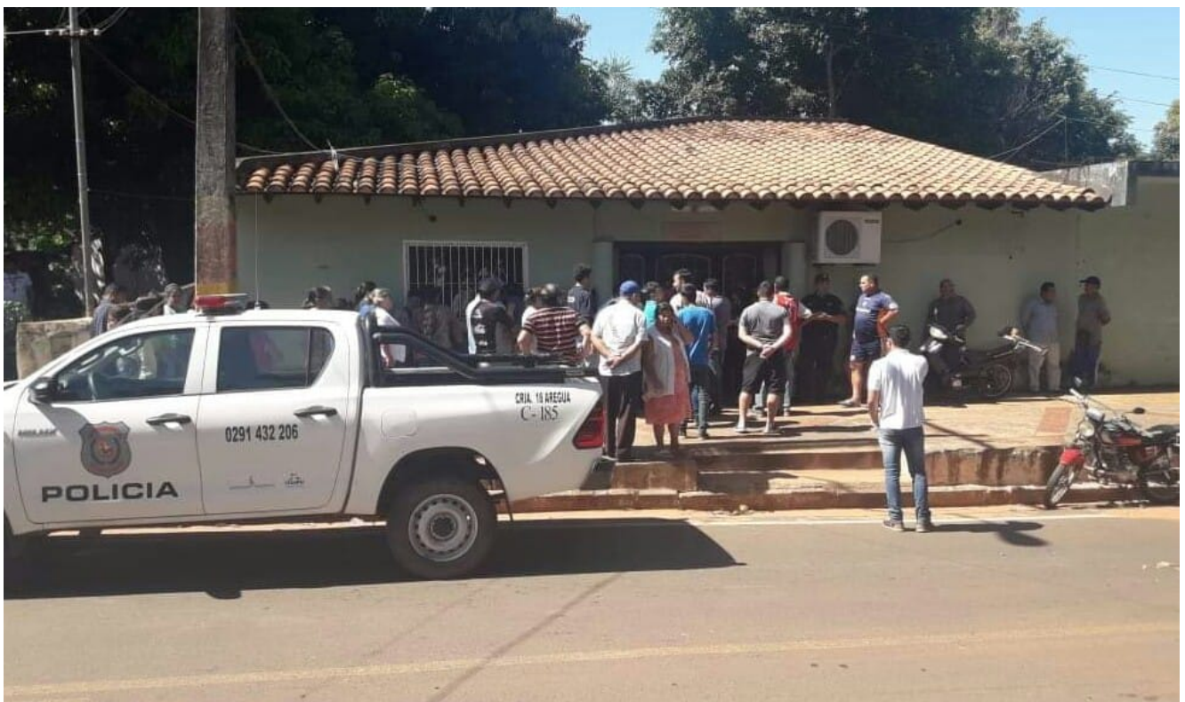
Escenario del crimen. En el local de la Junta de Saneamiento